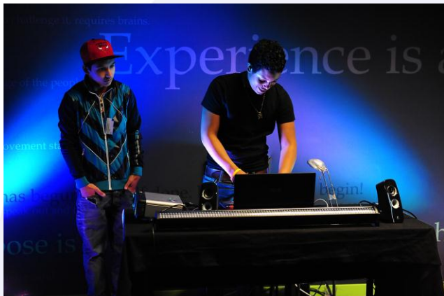
Leerlingen in actie tijdens CLA

Kijk op www.cultuurindespiegel.nl of download: http://www.cultuurparticipatie.nl/reports/cis_fianne_def.pdf