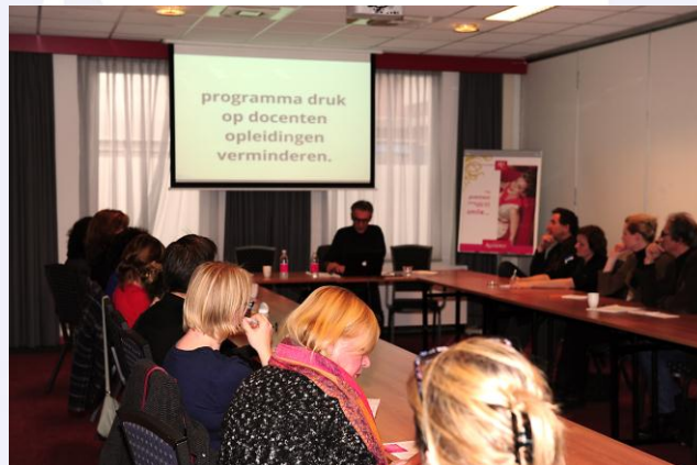
Presentatie Verkeningscommissie Kunstvakken tijdens CLA