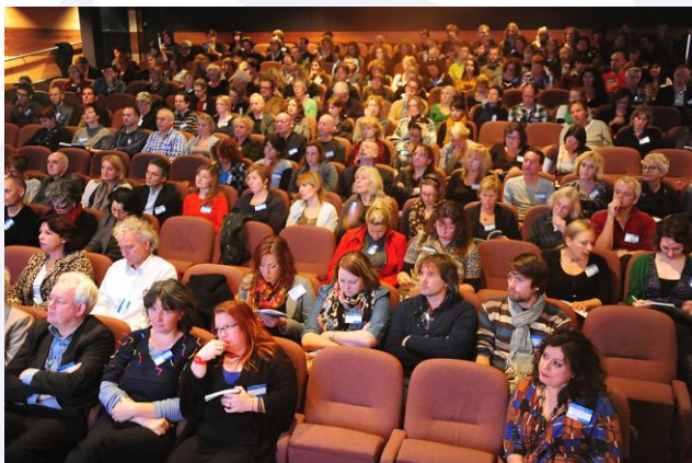
Conferentie Cultuur Leert Anders V (CLA) 1 december 2011, De Reehorst te Ede

Cultuuronderwijs heeft grote toegevoegde waarde voor uw leerlingen. Daarom is cultuuronderwijs een verplicht onderdeel van het curriculum. Bij cultuuronderwijs hoort het meemaken van culturele activiteiten die in samenwerking met culturele instellingen worden vormgegeven. Dat kost geld.