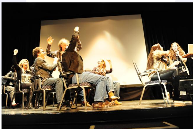
De 'busopstelling' tijdens CLA

De uitvergrotingen en de gedichten vallen erg op en maken van de leslokalen een echte kunstgalerie. http://www.aletta.nl/aletta/bericht.php?school_id=4&id=1548