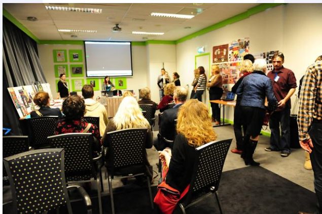
Een van de workshops tijdens de conferentie CLA

Voor de regio-indeling zie laatste bladzijde.