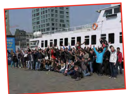
Leerjaar 3 HV op excursie in het havengebied van Antwerpen.