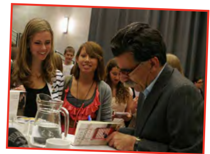
Tweede fase project 'Multi-culti dat ben jij!' afgesloten met lezing van Kader Abdolah.

De afgelopen periode is er hard gewerkt om de laatste stappen te zetten ter voorbereiding op het examen. Een drukke periode die in het teken stond van afrondingen van allerlei zaken zoals profiel en sectorwerkstukken, handelingsdelen, of leerlingen die nog snel even een toets wilden herkansen. Tussendoor nog proefexamens en examentrainingen! Kortom, veel zaken die in een korte periode aan bod gekomen zijn en die allemaal gericht zijn op een zo goed mogelijke voorbereiding van de leerlingen voor het centraal examen. Op 16 mei is het dan zo ver en gaan de leerlingen voor Havo en het VWO beginnen. Op 17 mei starten de VMBO ers. Wij wensen hen veel succes!